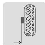
Eje lateral con tubo